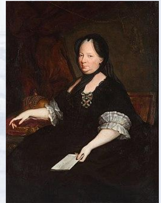
Anton von Maron, Carica Marija Terezija kao udovica (1772.), Ptuj